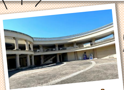
会場:パティオ広場