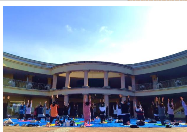
今年のイベントの様子