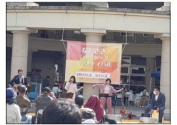
アンバランスさん