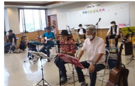
光南台フォーク村さん