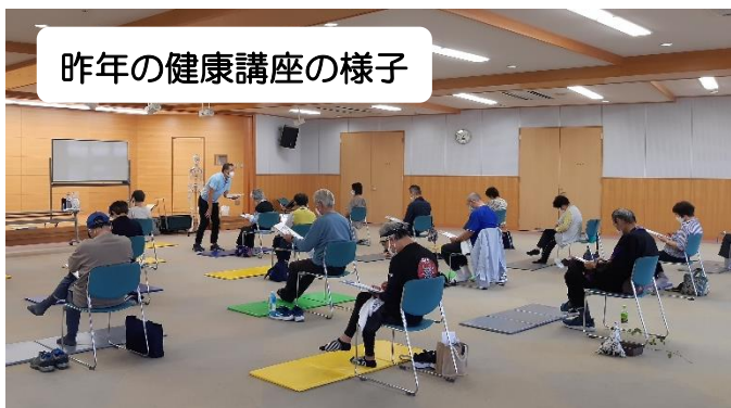
昨年の健康講座の様子