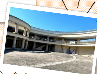
会場:パティオ広場