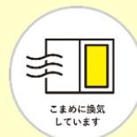
こまめに換気しています