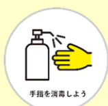
手指を消毒しよう