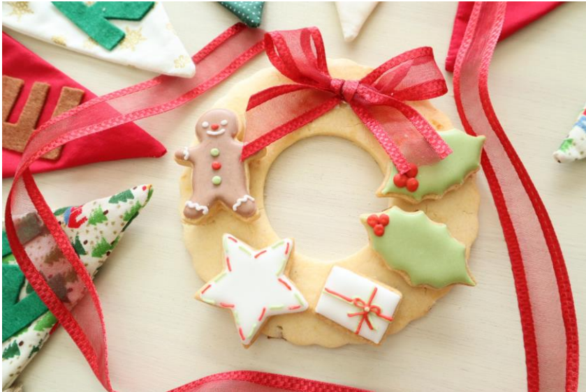
写真はイメージです。 アレルゲン：卵・小麦粉・乳