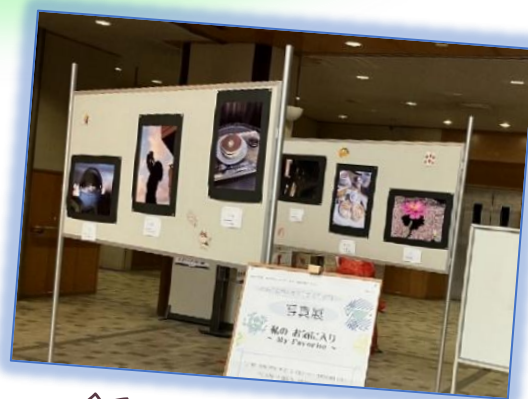
令和7年11月開催の様子