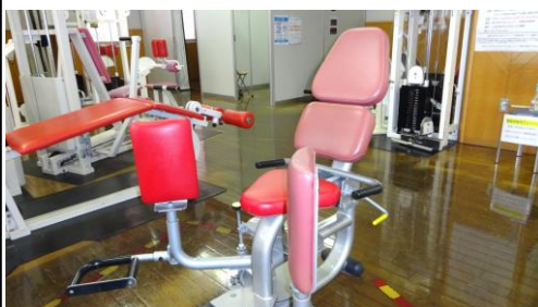
アダクション& アブダクション