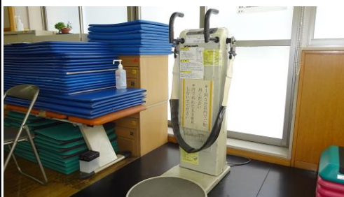
ベルトマッサージ