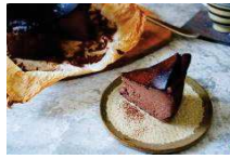
↑写真はイメージです。