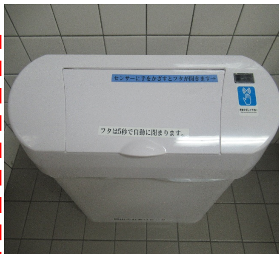
設置されているサニタリーボックス