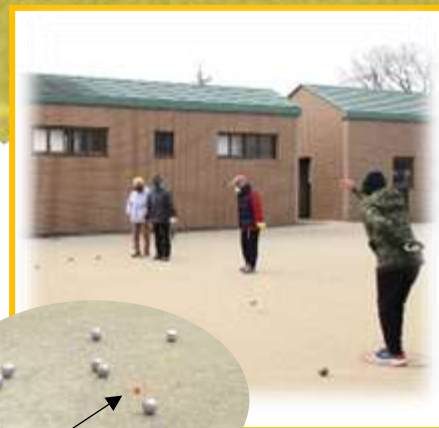
赤いボールが目標！