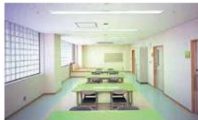
西南仲よし (1階) 通所により社会とのつながりを持たせ、心身障害者の自立を促すための作業訓練を行っています。