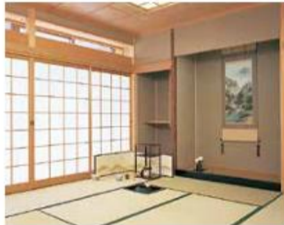
和室 (3階) 茶室としても使用できる、20畳の和室です。