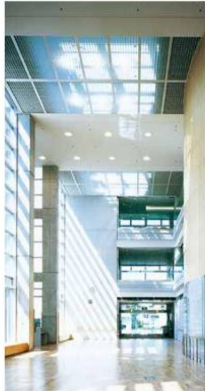
ガレリア (1階) 吹き抜けのガレリアは光があふれ、市民の方々のゆとりとふれあいを生み出すくつろぎの空間です。