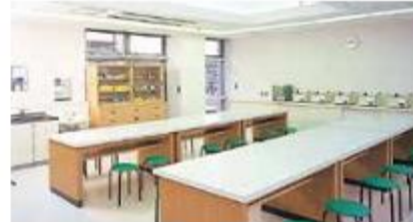
工芸室 (3階) 各種設備を備え、絵画や陶芸などの生きがいづくりのための講座を行っています。