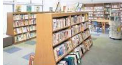
情報コーナー (3階) 福祉・保健・生涯学習関係を中心とした書籍やDVD等を備え、閲覧・貸出を行っています。