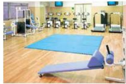
アスレチックコーナー (2階) 機能回復訓練や、各種トレーニング機器を使った健康づくりのための運動ができます。