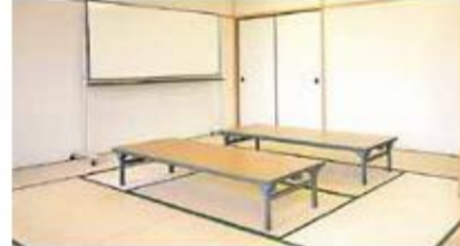
ボランティアルーム (2階) ふれあいセンター登録のボランティアの方々の活動拠点として、ご利用いただけます。