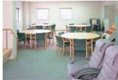
岡山市南区西地域包括支援センター (1階) 地域で暮らし高齢者の方を対象に保健・医療・福祉・介護などさまざまな面から総合的な支援を行っています。