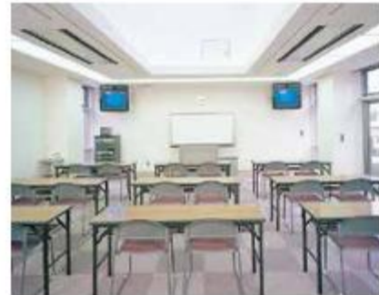
第1・2研修室 (3階) 第1研修室30名・第2研修室24名までご利用いただけます。