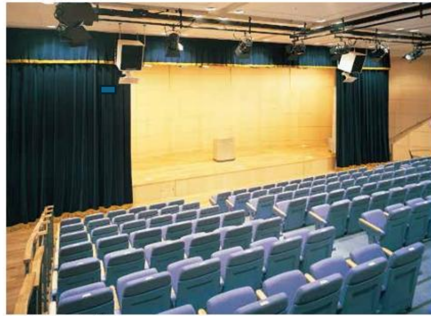
ふれあいホール (3階) 192席の多目的ホールで、コンサートや講演会、映画鑑賞会等にご利用いただけます。可動式座席を収納するとフロアになり、各種イベントにも対応できます。