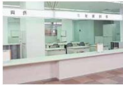
岡山市南区西福祉事務所 (1階) 公的扶助並びに各種の社会福祉サービス事業を行う福祉行政の最前線として設置されています。