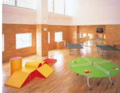
プレイルーム (2階) 児童館や講座で使用しない時間帯に、卓球やダンス等にご利用いただけます。