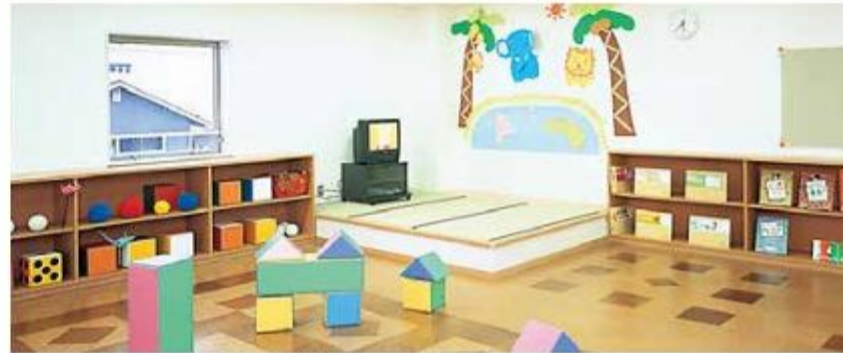
岡山市西ふれあい児童館 (2階) スポーツ・工芸・イベント等を通して、幼児や放課後の児童の健全な育成を図ります。