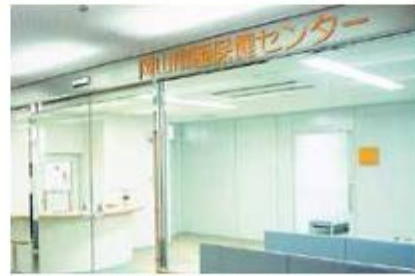
岡山市南区西保健センター (2階) 母子保健、健康増進、精神保健、難病業務等で地域におけるきめ細かな保健サービスの実現を目指しています。