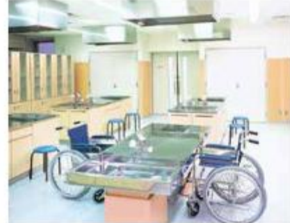
調理実習室 (2階) 4台の調理台と、各種調理器具・食器を備えています。車いすの方も利用できる昇降式の調理台もあります。