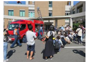
写真は以前の物です。

日時：6月14日(日) 10:30～11:30 (受付：10:00～ 5階マスカットホール) 対象：幼児・小学生とその保護者 定員：先着 20組程度 参加費：無料 場所：5階 マスカットホール / 1階 北玄関前駐車場 講師：岡山市西消防署職員 申込み： 電話または直接児童館へ申し込んでください。 ※戶外での見学になりますので、帽子の着用・体温調節等が出来るようにお願いします。 ※雨天の場合は、消防車見学は中止になり、内容は変更になります。 緊急出動があった場合は、その時点でイベントは終了になります。 ご了承ください。