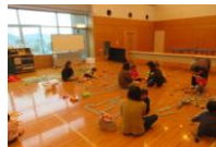
写真は以前の物です。

日時：7月26日(日) 13:00～17:00 対象：どなたでも (幼児は保護者同伴) 参加費：無料 場所：5階 マスカットホール 内容：卓球・バドミントン (小学生以上) ボードゲーム、オセロ、 ドミノなど