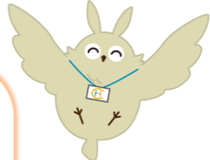
ほうほう (岡山市地域包括支援センターキャラクター)