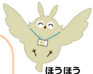
ほうほう (岡山市地域包括支援センターキャラクター)

岡山市東区西大寺中2-16-33 TEL : 086-944-1866 平日 8:30~17:00 【担当中学校区】 西大寺 上南 山南 旭東