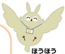
ほうほう (岡山市地域包括支援センターキャラクター)

岡山市地域包括支援センターの 認知症担当キャラクターです。 もの忘れが気になりはじめたら 相談してみよう! 認知症への備えが最初の一步。