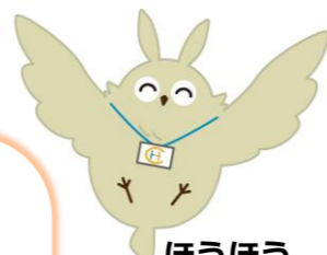
ほうほう (岡山市地域包括支援センターキャラクター)