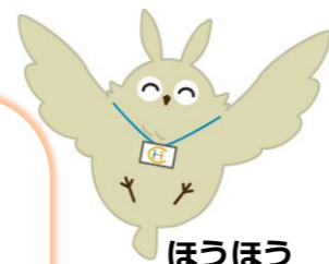
ほうほう (岡山市地域包括支援センターキャラクター)

岡山市東区西大寺中2-16-33 TEL: 086-944-1866 平日 8:30~17:00 【担当中学校区】 西大寺 上南 山南 旭東