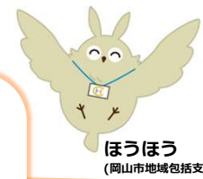
ほうほう (岡山市地域包括支援センターキャラクター)

岡山市地域包括支援センターの 認知症担当キャラクターです。 もの忘れが気になりはじめたら 相談してみよう! 認知症への備えが最初の一步。