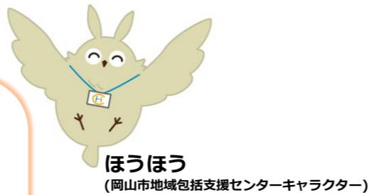
ほうほう (岡山市地域包括支援センターキャラクター)

岡山市地域包括支援センターの認知症担当キャラクターです。もの忘れが気になりはじめたら相談してみよう! 認知症への備えが最初の一步。