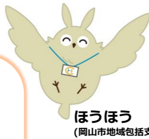
ほうほう (岡山市地域包括支援センターキャラクター)

岡山市地域包括支援センターの 認知症担当キャラクターです。 もの忘れが気になりはじめたら 相談してみよう! 認知症への備えが最初の一步。