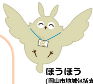
ほうほう (岡山市地域包括支援センターキャラクター)

岡山市地域包括支援センターの 認知症担当キャラクターです。 もの忘れが気になりはじめたら 相談してみよう! 認知症への備えが最初の一步。