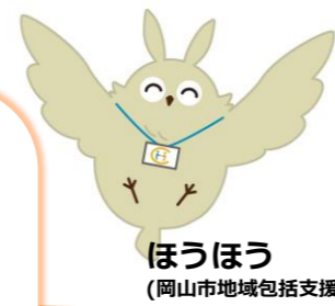
ほうほう (岡山市地域包括支援センターキャラクター)

岡山市北区門前392-1 TEL: 086-287-9393 平日 8:30~17:00 【担当中学校区】 高松 足守