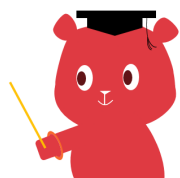
サボくま：岡山市地域包括支援センター 公認認知症キャラクター

詳細な実施場所・日時については、「市民のひろばおかやま」でご覧いただくか、 高齢者福祉課又は各地域包括支援センターへお問い合わせください。