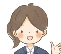
主任ケアマネジャー

地域包括支援センターは、地域で暮らす高齢者のみなさんを 保健・医療・福祉・介護など様々な面から総合的に支える機関です。