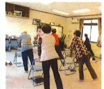
あつ晴れ！もも太郎体操