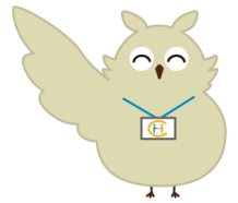
岡山市地域包括支援センター キャラクター ほうほう

少子高齢化が進み、多様性の時代から困りごととも様々です。 公的なサービスでは対応が難しいことが増えてきています。