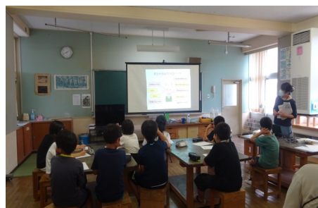
旭操小学校 あげぼのクラブ