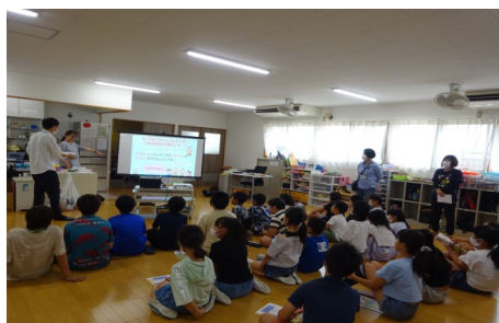
竜之口小学校 児童クラブ