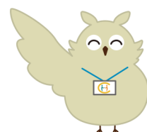
岡山市地域包括支援センター キャラクター ほうほう

少子高齢化が進み、多様性の時代から困りごととも様々です。公的なサービスでは対応が難しいことが増えてきています。