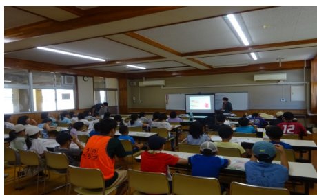
宇野小学校 うのクラブ