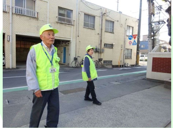
「三軒防犯 さわやかパトロール隊」