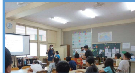
旭操小学校 あげぼのクラブ