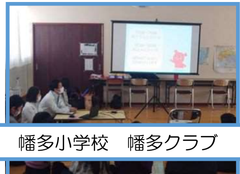
幡多小学校 幡多クラブ

岡山市地域包括支援センターでは、認知症について正しい理解と知識を持ち、地域で認知症の人やその家族に対して、できる範囲で手助けをする「認知症サポーター」を養成し、『認知症になっても安心して笑顔で暮らせるまちづくり』を目指しています。認知症サポーター養成講座は10名以上の団体・グループであれば開催可能です。詳しくは中区地域包括支援センターまでお問合せください。