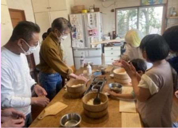
話し合いから生まれた通いの場 「おむすびdeポン!!」