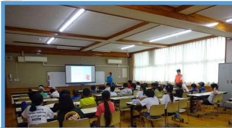
宇野小学校 うのクラブ

今年度、たくさんの小学校・放課後児童クラブで 認知症キッズサポーター養成講座を開催させていただきました。