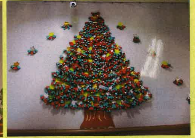
毎月の壁面作品(クラフト活動)