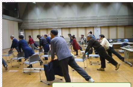
健康増進・介護予防